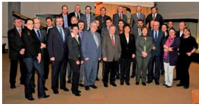
Den Startschuss für die im Frühjahr beginnende Umsetzung gab nun die Regionale 2010-Agentur mit der Auftaktveranstaltung am 28. Februar im 2011 Römisch-Germanischen Museum der Stadt Köln.

Drei Informations- und Dokumentationszentren vermitteln künftig Aspekte zur Geschichte und Bedeutung der beiden Römerstraßen. Diese werden überdies jeweils sieben Infopunkte mit Besucherparkplatz erhalten, die in Anlehnung an den lateinischen Begriff für einen Aufenthalts- und Rastplatz „Mansio“ genannt werden. Einer davon wird in Zülpich bei Schwerfen entstehen.