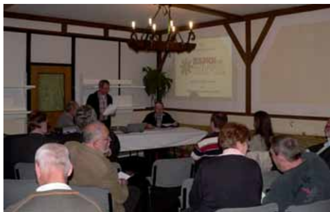
Interessierte Zuhörer bei der Mitgliederversammlung.

Blutspender Lebensretter im Kreis Euskirchen DANKE !